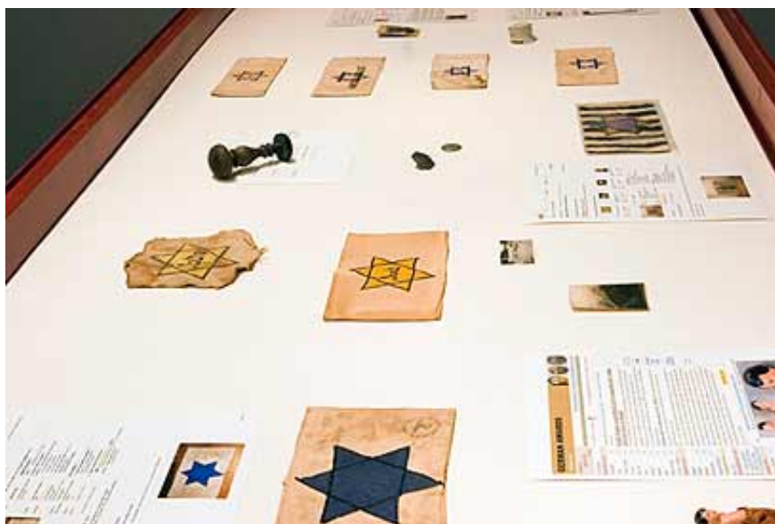
"פועל בתוך ההיסטוריה של שנות ה-70". מתוך התערוכה

ישראלי פועל בתוך ההיסטוריה של אמנות שנות ה-70, בה אמני מיצג כמו יוכבד ויינפלד תיעדו טקסים הקשוריו ולכאב . ישראלי עצמו תיעד את עצמו בעבר תופר לגופו זר גרברות אדומות, אבל באופן רציני יותר וללא האירוני המאפיינת את העבודה הנוכחית.