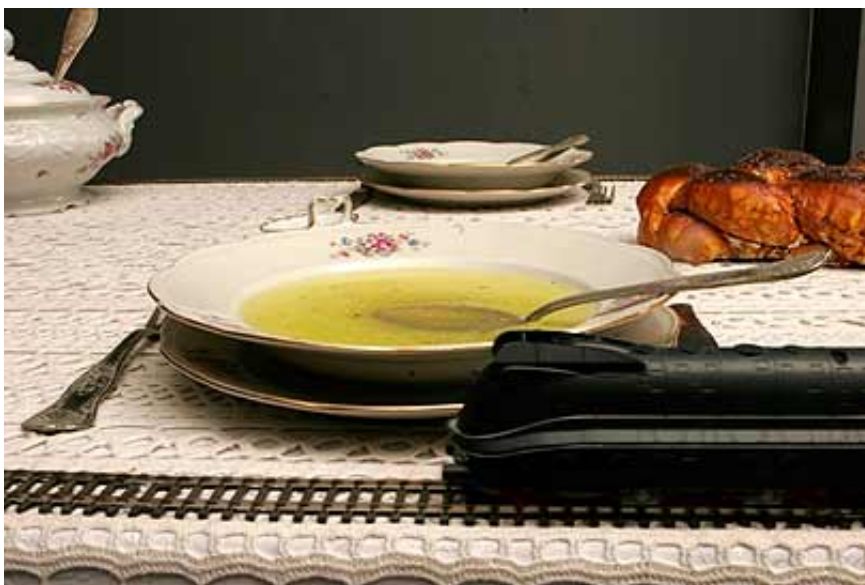
מרק הוא שריד מומצא למשפחה שנספתה בשואה

סך הכל, להתעסק בסמלי שואה ובזיכרון עלול להיות רגשני ומסוכן; ישראלי בוחר באסטרטגיות של הרחקה ומגן "מהלך". המהלך הוא התרופה שישראל מקדים למכה, כאשר הוא מציג את הטלאי הצהוב כדימוי שעובר גלגול הוא מזכרת מהשואה, פעם שריד ממיצג מתועד ופעם הוא שחקן בתוכנית "עשה זאת בעצמך", בה הוא מלמד להכין טלאי אותנטי על ידי גזירה וטבילה בנס קפה.