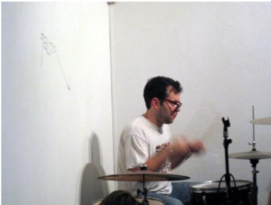
בר פאבר מאשכרע מתים. נותן את הקצב

מולי על שולחן הכתיבה הישן מעץ (שמסתיר לי את שדה הראייה ומאלץ אותי לקום אחת לכמה דקות) יושב רצ המשורר. הוא כותב שיר ומקליד אותו למחשב וזה משודר און-ליין לקיר שממול. אני מצליחה לראות את הטקסט הארץ פה פעור דדם נפל בפח אמר פיספוס, אמר פוס, אמר אופס", וכל מיני מילמולים דאדאיסטים, שחלקם בן משמעות וחלקם צלילים. זה ממשיך ככה: "דדם חשב שהוא גמר אבל הדם עוד חם, חם בדם חם (על אחותך)"