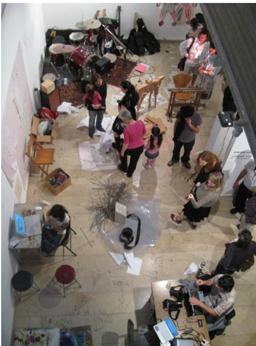
מרחב התערוכה בעין הוד. השתתפות פעילה

לקול של גונג נכנס כמו צוות מאומן צוות הפעולה של מבצע האמנות: "שעה אקדמית" - כמניין הדקות בשיעור א צלמים, אמנים, הורים, אחים, בת זוג, מזיזים כמו עובדי במה בתיאטרון תרמילים, כבלים חשמליים, מחשבים ע מערכת תופים מגברים, גיטרות, מקרן ועוד. הפעולה האמנותית וההצבה תחומים בזמן של 45 דקות, כמו גם ה הזה שאני כותבת בזמן ההצבה, טקסט המוגבל לכתיבה של 45 דקות ומכתיב כתיבה אוטומטית.